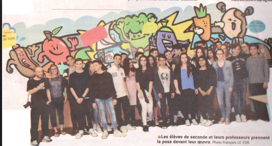
Les élèves de seconde et leurs professeurs prennent la pose devant leur œuvre.

C'est, en grammes, le volume des déchets par personne au lycée de la Côtière. La moyenne nationale est d'environ 200.